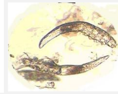
AYAM A MAKAIGAPU ITI GUDGUD