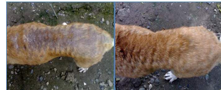
Sakbay nga agasan